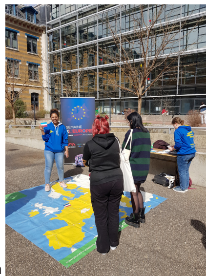
Animation carte géante et quizz sur l'Europe assurée par l'équipe Les Jeunes Européens - Lyon